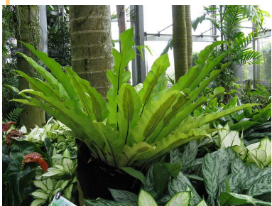
LA LANGUE DE BŒUF